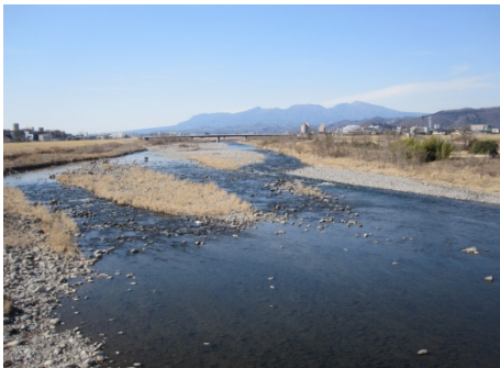
渡良瀬川 (渡良瀬浄水場取水口付近)