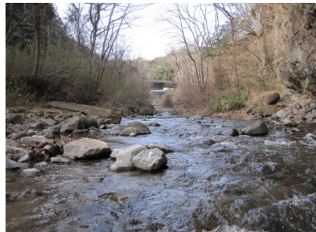
川口川 (塩原浄水場取水口付近)