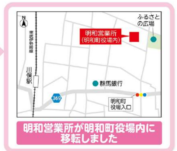
明和営業所が明和町役場内に移転しました