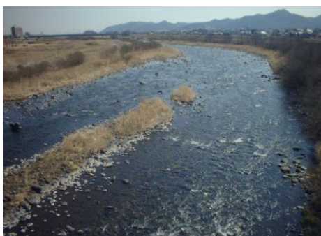
渡良瀬川 (渡良瀬浄水場取水口付近)