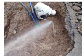
老朽化した管路の漏水

群馬東部水道企業団のホームページが4月1日にリニューアルしました。こちらよりご覧ください。