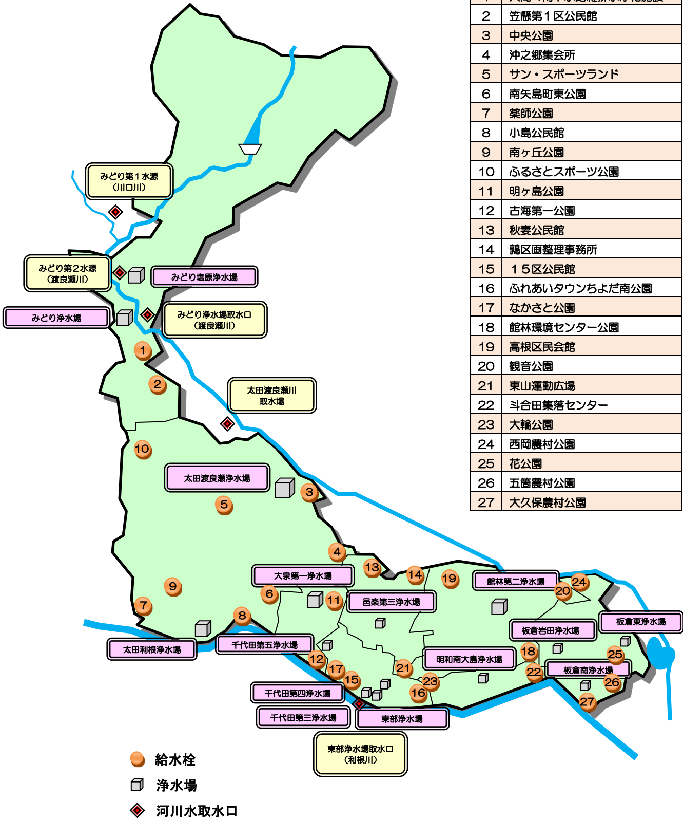
図1 水質基準検査 検査地点