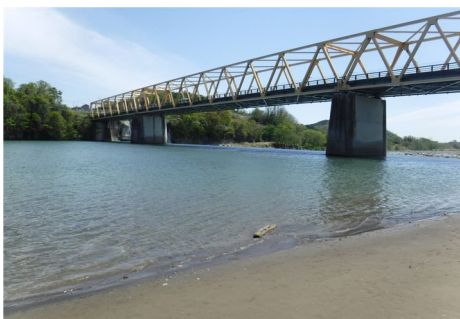
利根川 (坂東橋付近)