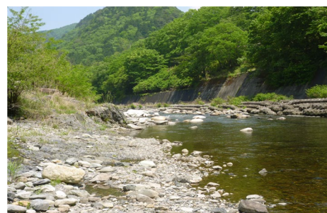
渡良瀬川 (源五郎沢堆積場付近)