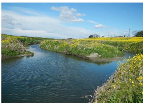
利根川 (休泊川合流点付近)