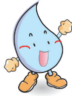
O Consumo e a Receita da Conta de Água