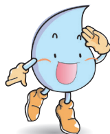
Water Consumption and Charges