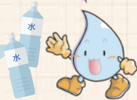
【新料金表(1か月あたり 税抜き)】