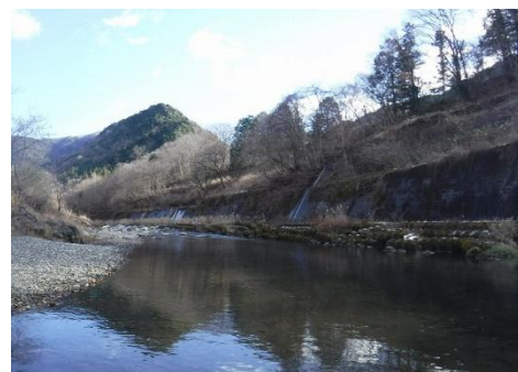
渡良瀬川 (源五郎沢堆積場付近)