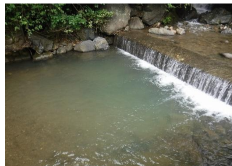
小平川（渡良瀬川支川） （小平川親水公園付近）