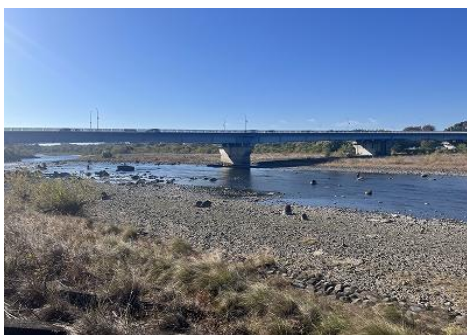
利根川 (大渡橋上流)