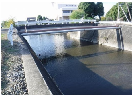
新谷田川放水路（利根川支川） （中里大橋付近）